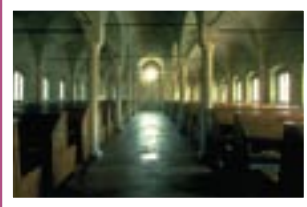
Biblioteca Malatestiana, FC