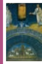
Galla Placidia, RA